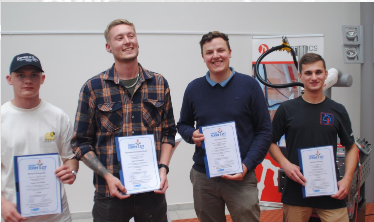
Bild 18: Sieger des ehemaligen Landesverbandes Hamburg/Schleswig-Holstein von links nach rechts: