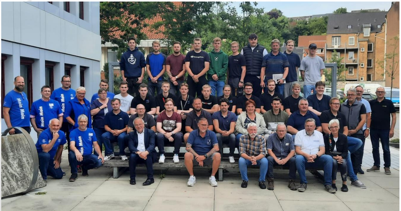
Bild 1: Teilnehmer, Betreuer, Jury-Mitglieder, freiwillige Helfer zusammen mit dem Hauptgeschäftsführer des DVS Verbandes Dr.-Ing. Roland Boecking am Vorabend des Landeswettbewerbes „Jugend schweißt“

Der schweißtechnische DVS Wettbewerb „Jugend schweißt“ verfolgt das Ziel den jungen metall- und schweißtechnischen Nachwuchs langfristig für die Technologiefelder des Fügens, Trennens und Beschichtens zu gewinnen. 16- bis 23-jährige Schweißerinnen und Schweißer kommen zu dem gemeinsamen Themenfeld zusammen, tauschen sich aus und messen ihre schweißtechnischen Fertigkeiten während des Wettbewerbs.