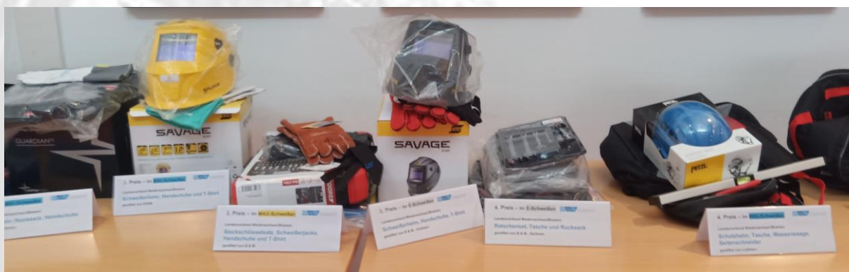
Bild 12 – 16: Tolle Preise erwarteten alle Teilnehmer. Unsere Sponsoren haben den Landeswettbewerb „Jugend schweißst“ mit so vielen Sachspenden unterstützt, dass jeder der 23 Teilnehmer nicht nur mit der Urkunde, sondern auch jeder mit einem Preis nach Hause gehen konnte! Das war einfach Spitze!!! Und die Teilnehmer haben sich alle sehr gefreut!