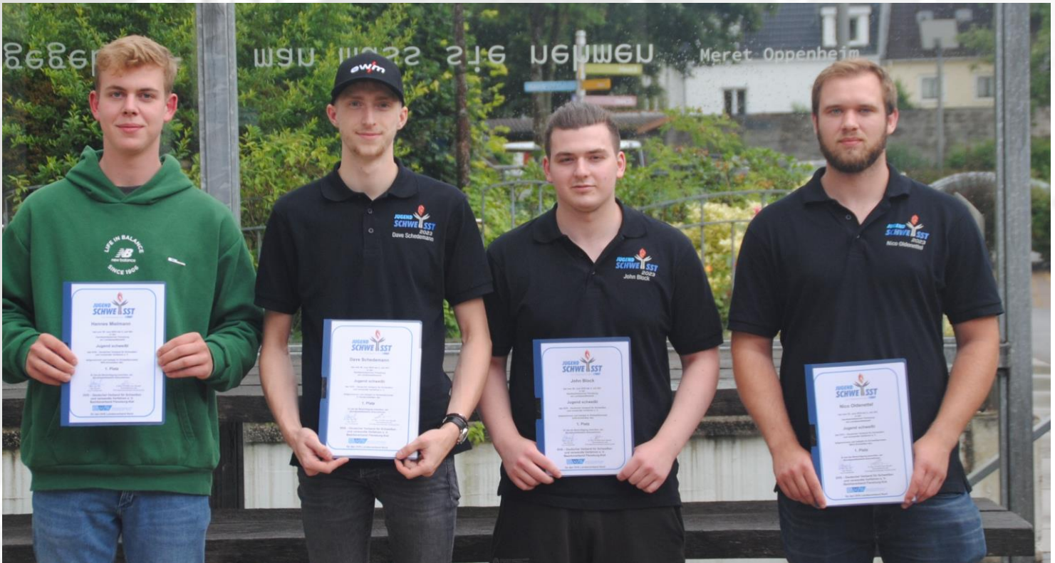
Bild 17: Sieger des ehemaligen Landesverbandes Niedersachsen/Bremen: von links nach rechts: